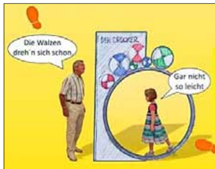
Abb.: Wettbewerbsbeitrag „Ab in die Mitte“, 2015 (Ausschnitt)

Den Antrieb dieses Elementes übernimmt ein großes Laufrad, das stabil gelagert ist. Wird dieses bewegt, werden die darüber liegenden Rollen, welche die Farbwalzen symbolisieren, angeschoben.