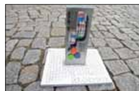
Abb.: Modell „Der Chemiker“, M. Stapf, 2015

Eine tatsächliche Vermischung der Stoffe findet jedoch nicht statt, da diese nicht rückgängig zu machen wäre.