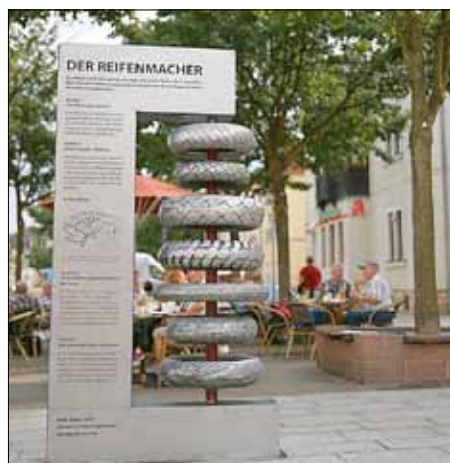
Foto: Der Reifenmacher hat seinen Platz auf der Ernst-Thälmann-Straße bereits gefunden.

Da steht er nun, der Reifenmacher oder besser gesagt, das, was ihn symbolisiert. Ein Stapel Reifen aus Heidenauer Produktion. Beinahe jedenfalls, denn original Heidenauer Reifen dienten als Gussform für die in der Metallsulptur aufgestapelten Reifen an der Ecke Ernst-Thälmann-Straße und Bahnhofstraße. Wer genau hinschaut, kann die Schriftzüge auf den Reifenflanken gut erkennen. Auch die Profile sind gut gelungen. So, wie der Künstler sich das vorgestellt hat und so, wie es in der Steuergruppe, die sich seit 2014 für die Innenstadtentwicklung stark macht, diskutiert wurde.