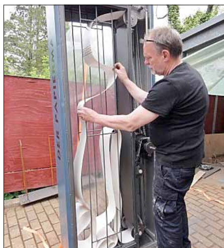
Foto: M. Stapf erläutert die Mechanik des „Papiermachers“ beim Werkstatt-Termin

Ein endloses „Papierband“ legt sich in immer neue Schlaufen